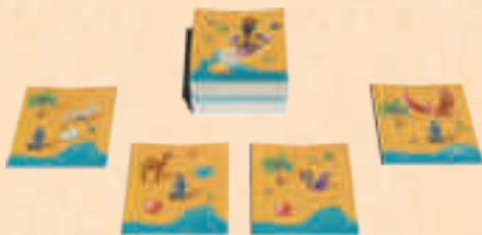
Exemple à 4 personnes

La Vigie pose sur la table, faces visibles, les tuiles piochées.