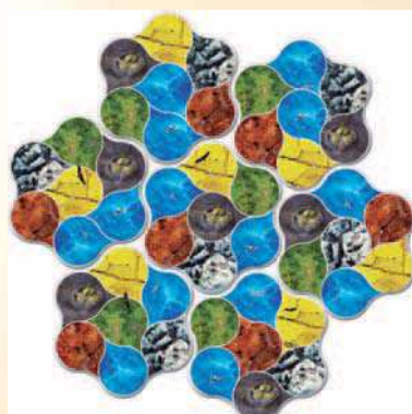
4 joueurs : 7 tuiles