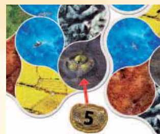
On place 5 PV sur ce village barbare car 5 régions l'entourent.