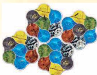
2 joueurs : 4 tuiles