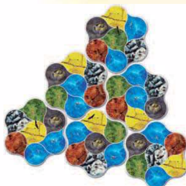
3 joueurs : 6 tuiles