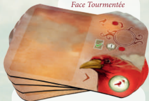
4 tuiles Tourment

Pour gérer la menace de la Corneille Rouge et atteindre la sérénité.