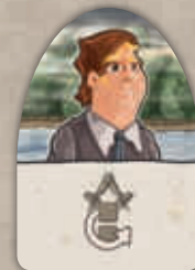
14 tuiles Contrat