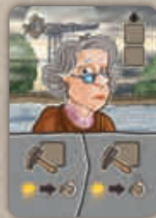
4 tuiles Architecte