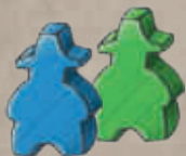
2 marchands (un par joueur)