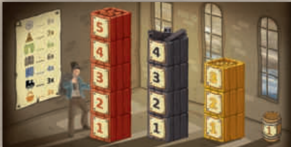
2 plateaux individuels