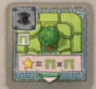
37 tuiles Bâtiment (8x Usine, 3x Magasin, 6x Parc, 6x Immeuble, 3x Gare, 4x Banque et 7x Monument)