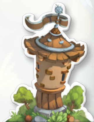
Tour de garde

S'il le fait, il doit poser sa Tour de garde UNIQUEMENT sur une Clairière de la tuile qu'il vient de jouer. Le jeton Tour de garde permet de se rappeler de la Tour de garde de chaque joueur. Chaque joueur doit toujours conserver son jeton à la vue de tous.