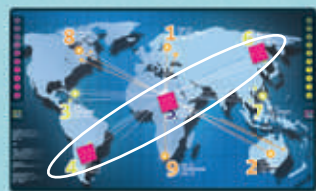
3 en ligne diagonal

Vous êtes un hacker réalisant des missions autant pour l'argent que la gloire. Votre contrat actuel consiste à infecter avec vos marqueurs Virus 3 serveurs principaux connectés en ligne (3-5-7, 1-5-9, 8-5-2, 4-5-6, 8-1-6, 6-7-2, 4-9-2, 8-3-4) d'où à en détruire un avec une attaque triple (3 marqueurs sur le même serveur).