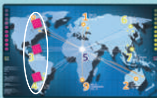
3 en ligne orthogonal