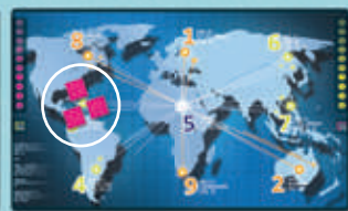
3 sur le même serveur