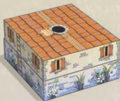
1 boîte Maison