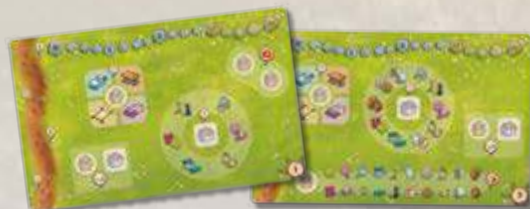
2 plateaux Questions recto verso