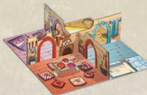
1 plateau Sol (inclut les murs et éléments 3D)