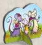
1 pion Souris