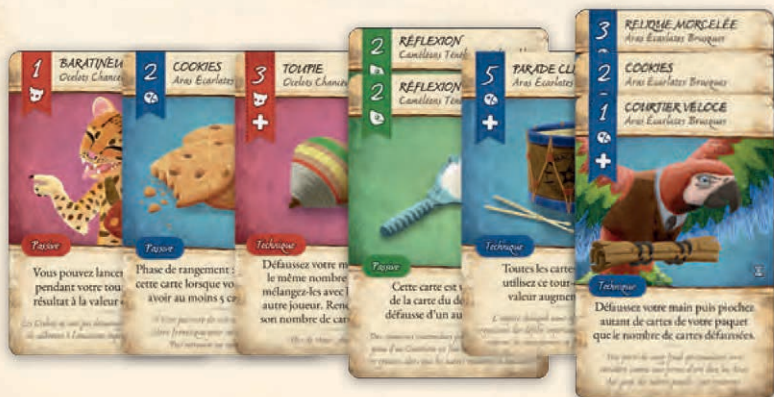
Exemple de l'étal d'un joueur contenant 6 piles (valeurs de 1 à 6)

Pour construire une pile, un joueur doit choisir n'importe quel nombre de cartes d'une même peuplade (même icône, même couleur) de sa main, puis les placer devant lui sur son étal avec toutes les valeurs visibles. Un joueur ne peut pas commencer une pile puis la terminer plus tard.