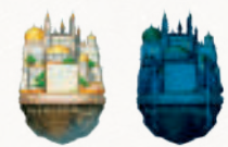
Cité volante : Jour / Nuit