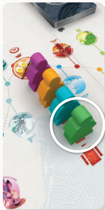
Le Voyageur vert repartira le premier du Relais

Le premier Voyageur occupe obligatoirement l'emplacement le plus près de la route. Les autres Voyageurs forment une file derrière lui.