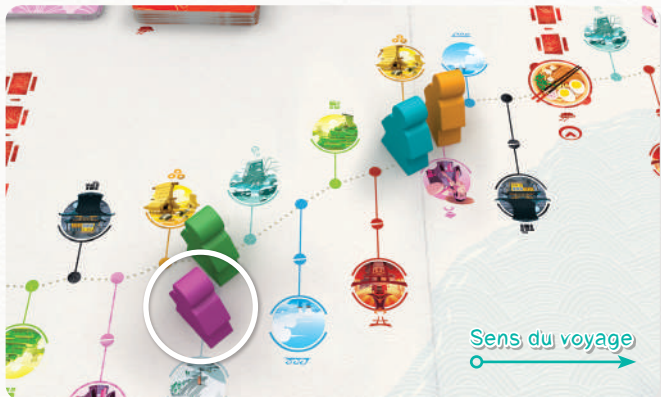
Le Voyageur violet est considéré plus loin que le Voyageur vert (emplacement double). C'est donc à lui de jouer.