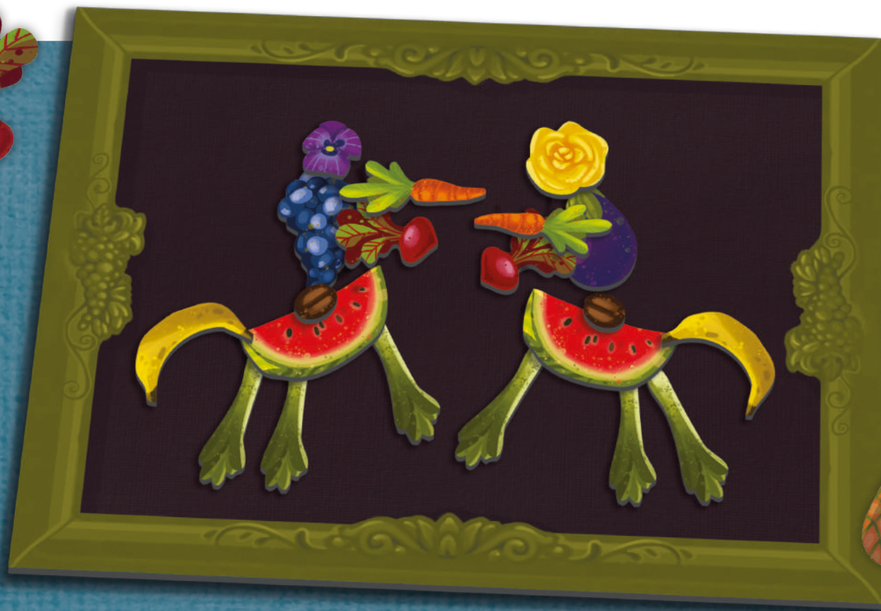
Exemple : Ce sont deux chevaliers qui se battent en duel avec des lances

Une fois que tous les joueurs ont terminé leur œuvre, il est temps de passer à la suite du tour. Il n'y a aucun temps imparti pour la création. En revanche, si des joueurs mettent trop de temps à réaliser leur œuvre, le Maître Arcimboldo est autorisé à les mettre en garde afin qu'ils terminent leur création.